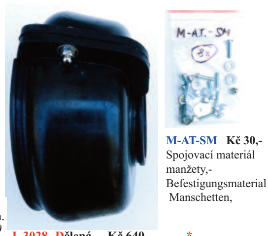
M-AT-SM Kč 30,- Spojovací materiál manžety,- Befestigungsmaterial Manschetten,