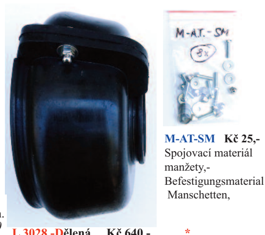
M-AT-SM KČ 25,- Spojovací materiál manžety,- Befestigungsmaterial Manschetten,