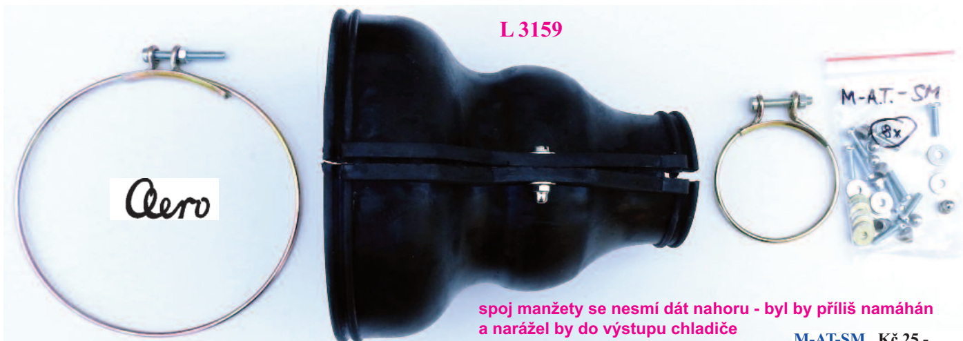
L 3173 KČ260,- Stahovací kroužek těsnění skříně prům.138 mm Befestigungring des d.138 mm

* Pozor - olejvzdorné pryže mohou reagovat s ozónem, proto je vhodné jejich venkovní stranu naolejovat, případně ošetřit přípravkem na ochranu pryže, prodlouží to několikanásobně jejich životnost.* Warnung - ölbeständig Gummi kann mit Ozon reagieren, ist es angebracht, ihre Party im Freien geölt oder mit einer Gummibeschichtung überzogen zu schützen, zu verlängern ihr Leben viele Male, dass.