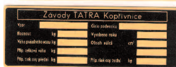
TATRA -1947- (153x52mm)