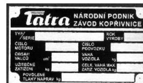
TATRA 600, 603-1 TS-T5 - ZN -400,-kč TS-T5 - MS -435,-kč