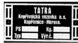
TATRA 12 TS-T3-MS 435,-kč (100x50 mm)