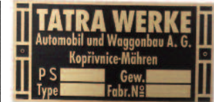
TS-T12 -MS 435,-kč