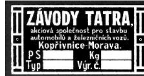
TATRA 57-čistá TS-T2 -MS 435,-kč