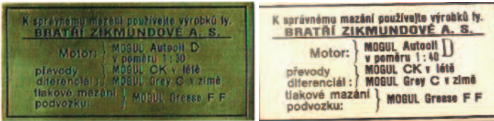
Aero 30,50 1936-38(90x45mm)