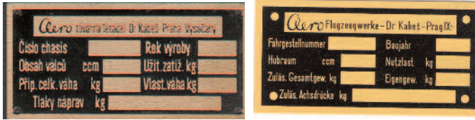
TS -A1-Č (106x53mm) TS -A1-D

TS-A1 - Aero 30,50 Typový štítek AERO 30,50 -česky oder Deutsche version mosazný-TS-A1 -MS,435,-kč (Messing) nebo zinkový : TS-A1 -ZN (Zink)400,-kč -(od roku 1940,-seit 1940)