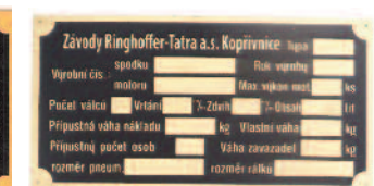
-1938 - TS-T14 -MS 435,-kč