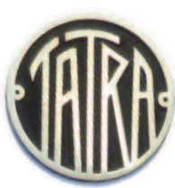
TATRA TS - P2 - MS -350,-kč