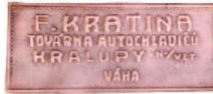
AERO 30,50 - 70x30 mm -měď,-