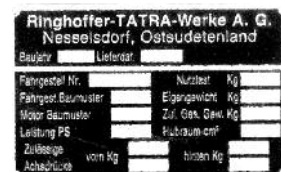
TATRA-1939-45 TS-T1-D-ZN -400,-Kč (115x72 mm)