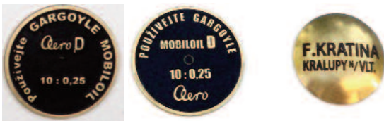
AERO 30 1934- 35