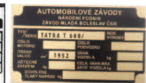
TATRA 600- Mladá Boleslav TS-T13 - ZN -400,-kč TS-T13 - MS -435,-kč