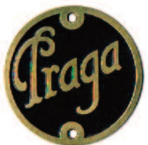
TS - P3 - MS -350,-kč