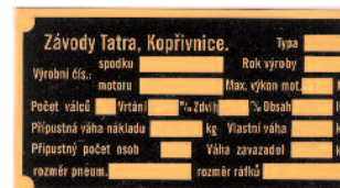
TATRA -1936 - TS-T6 -MS 435,-kč