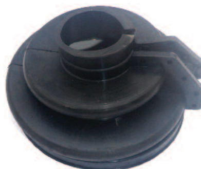
Škoda-399-5439 Kč 665,- * Škoda - manžeta kloubu -nedělená,-prům./durchm. 143/46x90 mm Manschette des Gleitkretzgelenkes,-