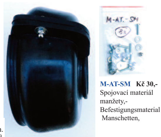
M-AT-SM Kč 30,- Spojovací materiál manžety,- Befestigungsmaterial Manschetten,