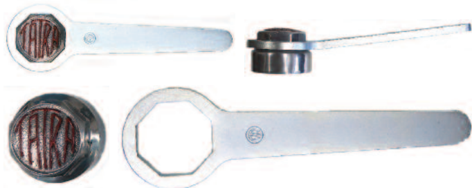
118520 Kč 730,- Klíč k uzávěrce kol,- Radkappenschlüssel