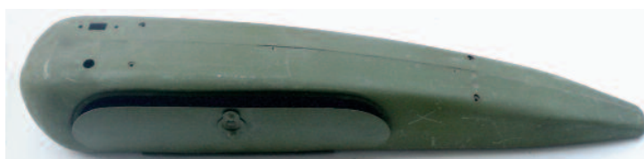
Kastlík na nářadí .....2200,-Kč (510mm-délka)