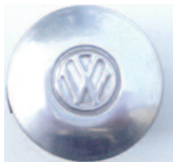
WV-popelník -hliník .....2500,-Kč