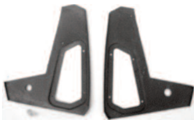
Stěna boční vnitřní, zadní, pravá nebo levá,-In- errere rückwärtige Seitenwand R. oder L. 441 9 2164 081 4 KČ 260,-