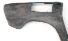
Pravý zadní blatník Škoda 100 KČ 100,-