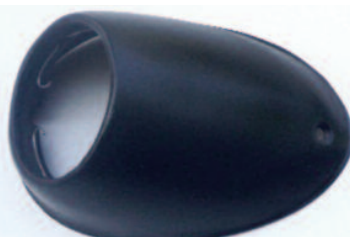
WV-koncové světlo levé .....100,-Kč - držák žárovky .....20,-Kč