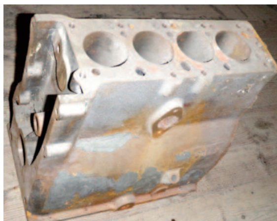
Opracovaný blok motoru Singer .....8000,-Kč