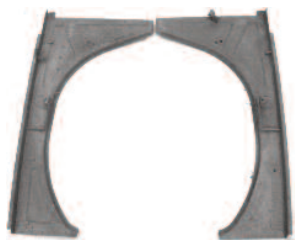
Vnitřní podélník podběhu pravý nebo levý,-In- errer Längsträger zum Radkasten R. oder L. 441 9 7319 074 4 KČ 260,-