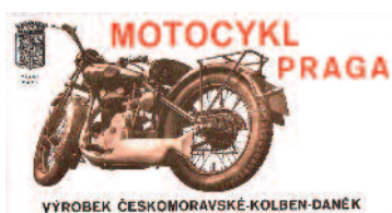
2 BD - 3 10 Motocykl BD - prospekt, Prospekt