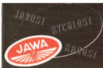
-JAWA -prospekt -1939 -nabídka modelů -20,-Kč JAWA-Prospekt-Angebote Modelle -1939