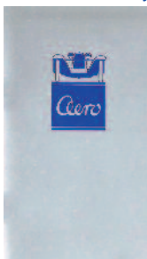
1-500- 3* 1931 10 Prospekt AERO 500,662 (ČESKY oder deutsch)