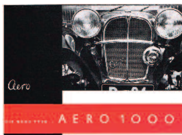
1-1000-1 1933 100 Prospekt AERO 1000 (nur deutsch)