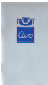
1-500- 3* 1931 10 Prospekt AERO 500,662 (ČESKY oder deutsch)