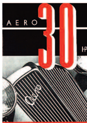
1-30- 4 1934 300 Prospekt AERO 30 (ČESKY oder deutsch)